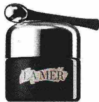
LA MER The Eye Concentrate (€ 185)